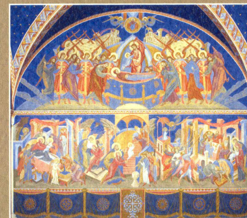
Duomo - Cappella Maria Madre della Chiesa Assunzione e incoronazione della Vergine o “Dormitio Virginis” (sopra) Natività della vergine Madre Maria in braccio ai genitori Presentazione della Vergine Maria al tempio

Studiosa di temi giuridici, comparativi e storico-evolutivi, è autrice del volume “L'identità religiosa nel rapporto di lavoro” , di saggi biografici tra i quali “La centralità della Santa Sede” , “La condizione giuridica dei ministri di culto” , e di numerosi articoli tra cui “Verso nuove forme di presenza scolastica della religione” , “Educazione alla convivenza ed educazione religiosa, un binomio antico e moderno” .